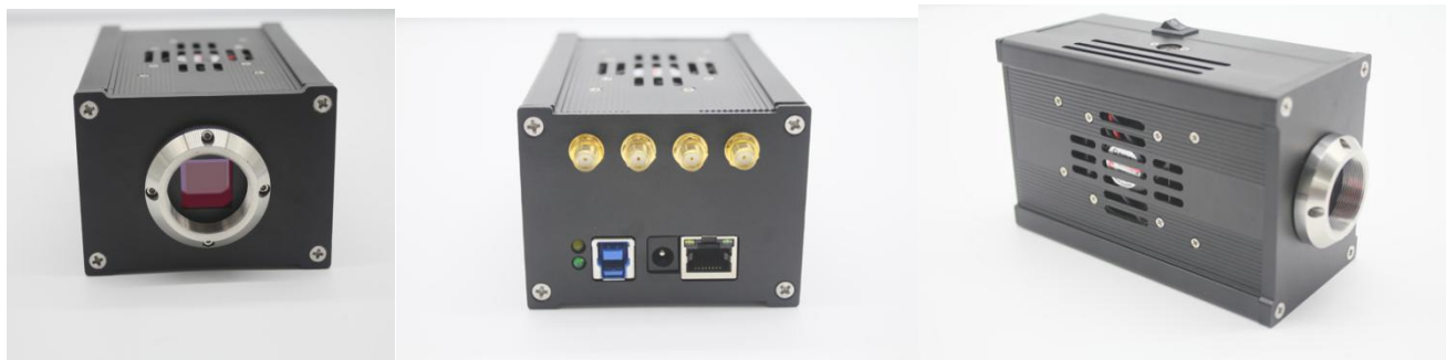
1200 万像素彩色/黑白 USB3.0 相机